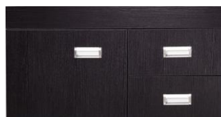
90 OL-7166 MADERA NEGRA