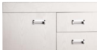
90 OL-7166 MADERA BLANCA